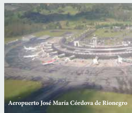
Aeropuerto José María Córdova de Rionegro