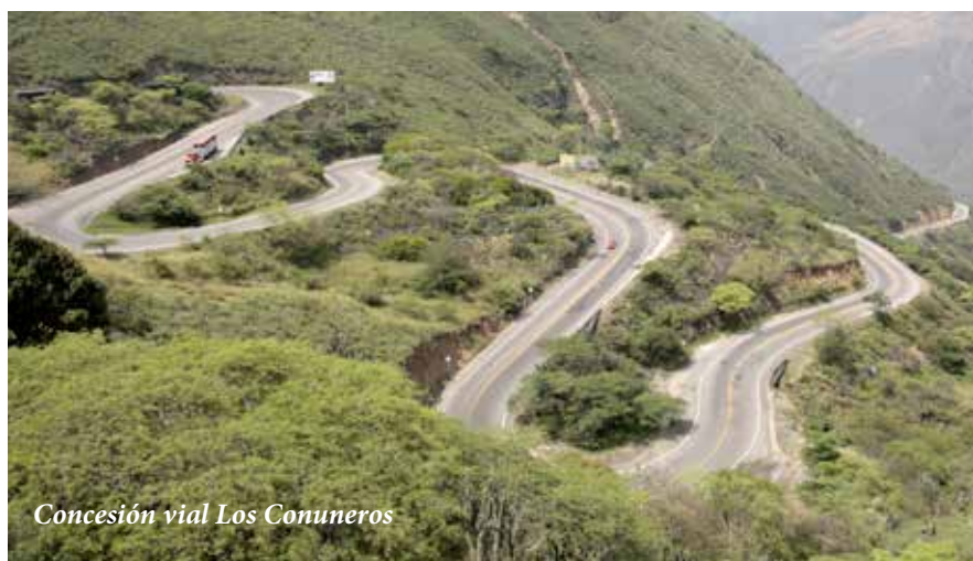
Concesión vial Los Conuneros

Las primeras 6 licitaciones inician en diciembre de 2012, con el proceso de pre-calificación de proponentes. Los demás proyectos saldrán a licitación entre abril y octubre de 2013, con el objetivo de tenerlos adjudicados para abril de 2014.