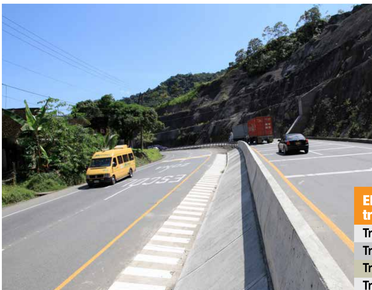
Doble Calzada Loboguerrero - Buenaventura