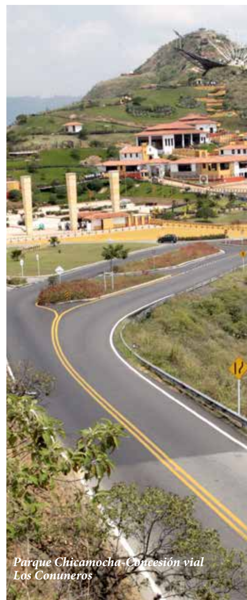
Parque Chicamocha-Concesión vial Los Conuneros

275 kilómetros más de dobles calzadas en el 2012.