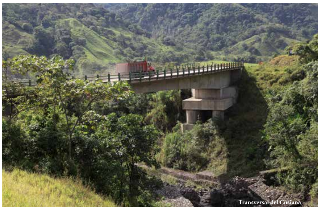
Transversal del Cusiana

Los estudios serán entregados a finales de 2013 y la obra iniciará en el 2014