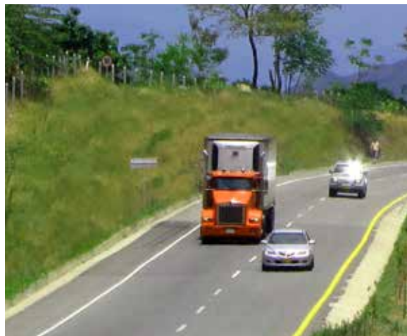
Doble Calzada Bogotá- Girardot