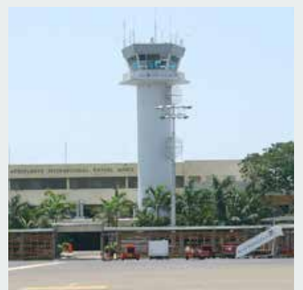
Aeropuerto Rafael Núñez de Cartagena

En este aeropuerto actualmente se adelanta la actualización del Plan Maestro con el fin de priorizar las obras dentro de las cuales se proyectará la construcción de un nuevo terminal internacional de 20.000 m 2 .