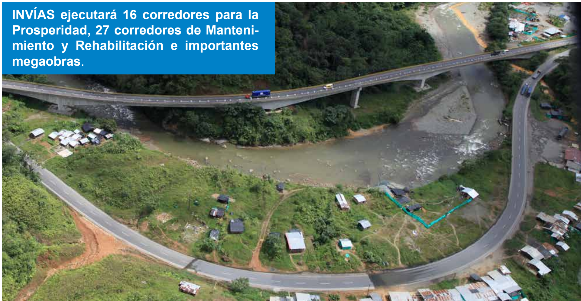
Viaducto Bendiciones: Doble Calzada Buga - Buenaventura

INVÍAS ejecutará 16 corredores para la Prosperidad, 27 corredores de Mantenimiento y Rehabilitación e importantes megaobras.