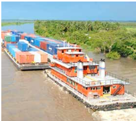
Convoy sobre el río Magdalena

Para el periodo 2011- 2012 se realizó el dragado de mantenimiento de los canales de Acceso de Barranquilla y Buenaventura (bahía interna). En Ciénaga se está construyendo el nuevo canal de acceso público por un valor de 70 millones de dólares, el cual terminará en 2013; también se inició la profundización de la bahía externa de Buenaventura con una inversión de 26 millones de dólares. Con la expedición del Decreto 3222 de 2011, a través del cual ha sido posible el ingreso al país de empresas dragadoras con equipos de alta capacidad y tecnología, se ha permitido la contratación de dragados con altos estándares y mejor relación de tiempo y costos.