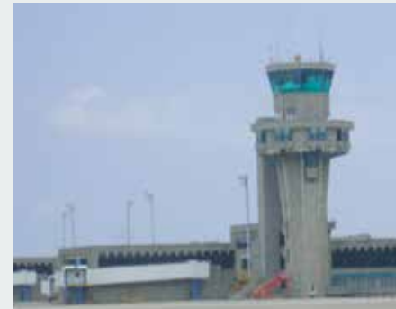
Aeropuerto Ernesto Cortissoz de Barranquilla

Esta obra también incluyó la entrega de vehículos y equipos de extinción de incendios