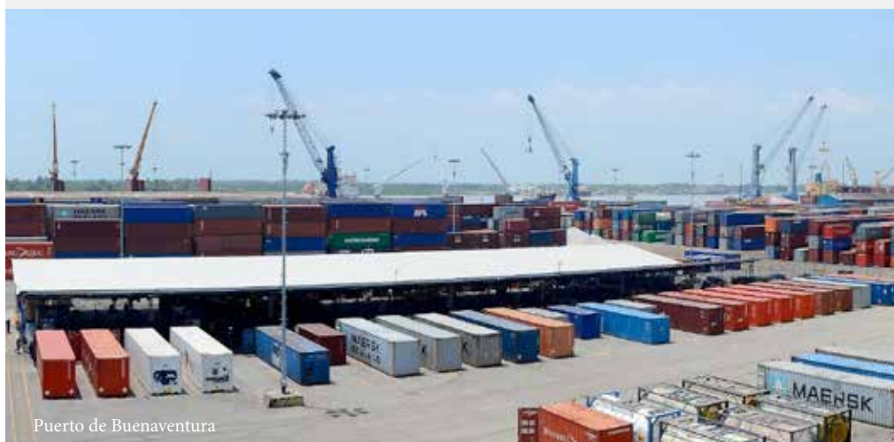
Puerto de Buenaventura

Las medidas tomadas por la Superintendencia deben convertirse en el punto de partida para que las autoridades competentes descubran posibles anomalías que se presenten en el Sector frente a la solvencia económica de las empresas que hoy están a cargo de la infraestructura concesionada del país y demás riesgos que se pudieran dar.