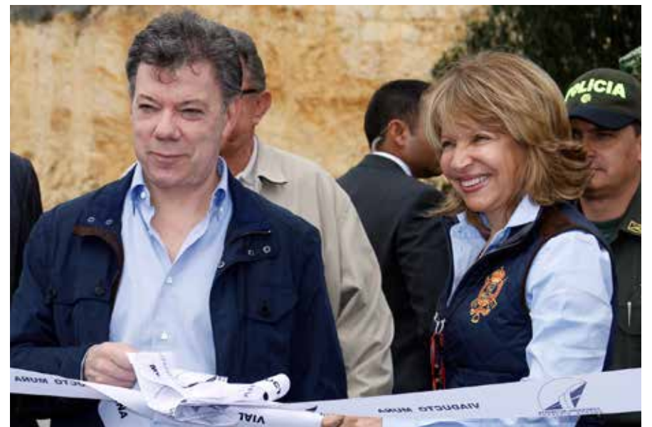
El Presidente Santos y la Ministra de Transporte en la inauguración del Viaducto del Muña, Doble Calzada Bogotá- Girardot

La meta del Gobierno es transportar al país hacia el desarrollo, ubicarlo en el más alto nivel de competitividad y conectarlo con todos los puntos estratégicos que le permitan asumir los compromisos internacionales de los TLCs, incrementando así nuestras exportaciones.