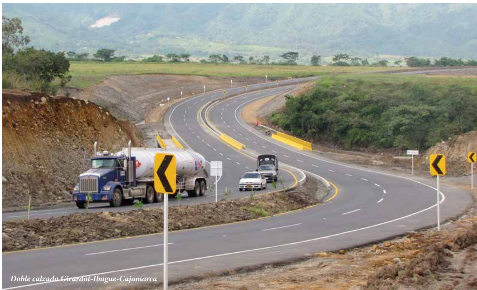
Doble calzada Girardot-Ibagué-Cajamarca

Esta no es la primera vez que Colombia enfrenta una dificultad similar. Hace 10 años se presentó una caída en la producción de petróleo. Sin embargo, hoy la situación es totalmente diferente, pues no sólo se incrementó la producción de crudo, sino que el petróleo es el principal rubro de exportaciones. El país tiene una producción cercana al millón de barriles por día, con la perspectiva de llegar a 1,5 millones para el año 2020.