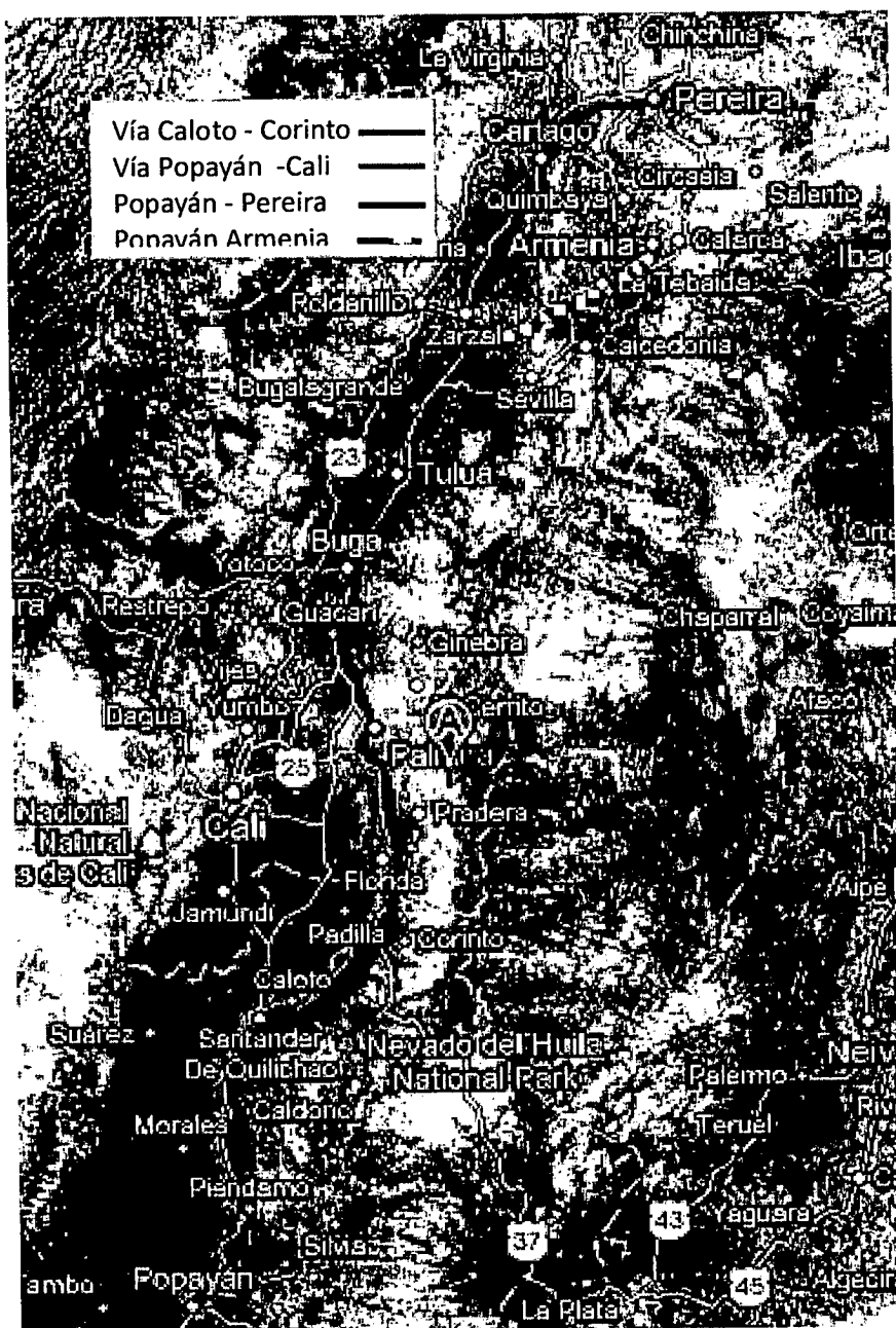
Figura 3.2 Ejemplo 2

Ejemplo 2, si se necesita categorizar la vía Caloto – Corinto, en el departamento del Cauca, se debe tener en cuenta que forma parte de la troncal 31 del Instituto Nacional de Vías y que su inicio está en el municipio de Santander de Quilichao y su final en el municipio de Palmira y que sería un error tomar la vía Popayán Cali o Popayán Pereira o Popayán Armenia para categorizar. Ver figura 3.2