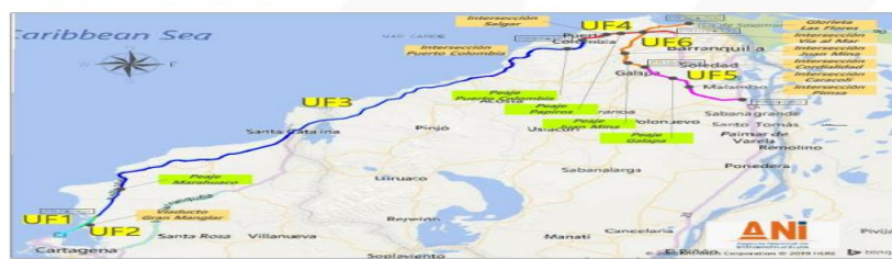
Alcance del Proyecto: