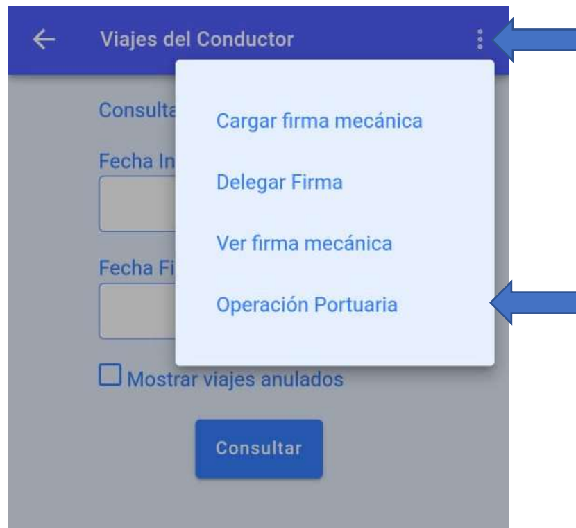
Ilustración 7. Registro de viaje operación portuaria

Luego de ingresar a esta opción se encontrará un formulario que deberá ser diligenciado en su totalidad, los datos a diligenciar corresponden a: