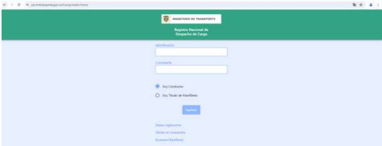
Ilustración 2. Acceso web - App RNDC transportador