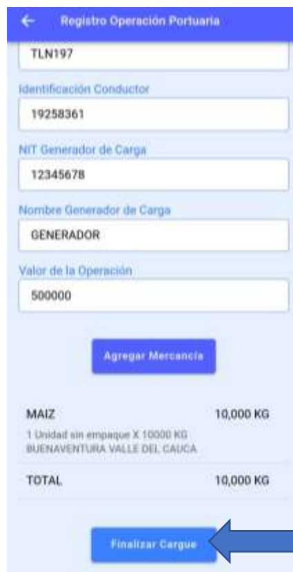
Ilustración 11. Registro de viaje- operación portuaria

El usuario podrá agregar todas las mercancías a transportar utilizando de nuevo la opción agregar mercancía, una vez se haya terminado el cargue de mercancías, debe seleccionar la opción "Finalizar cargue" y confirmar que se ha terminado el cargue.