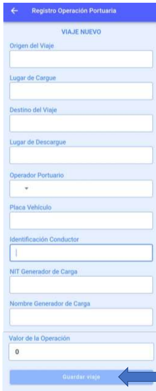
Ilustración 8. Formulario registro de viaje

A continuación, se habilitará la opción agregar mercancía, en la cual podrá agregar las mercancías que se transportaran en el viaje, se debe digitar y seleccionar la mercancía transportada y la cantidad transportada en kilogramos y seleccionar la opción aceptar.