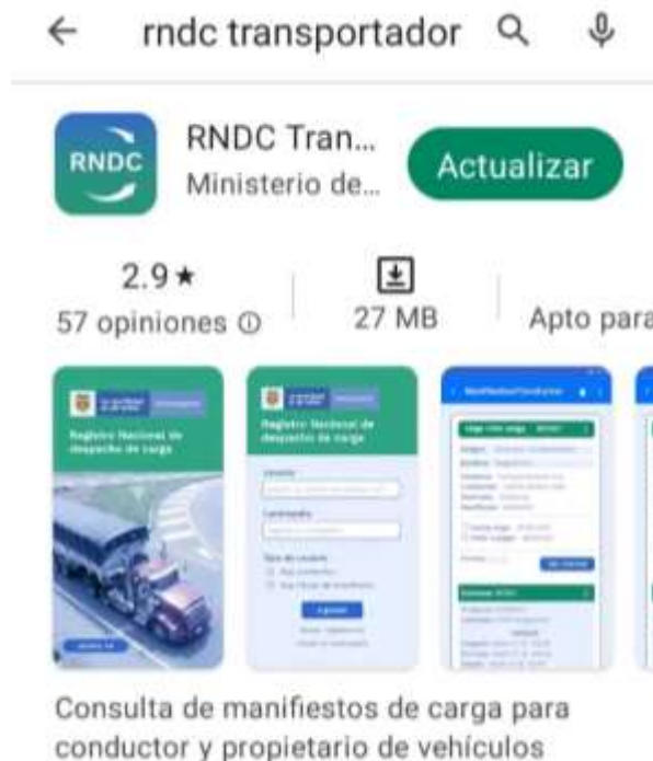
Ilustración 1. App RNDC transportador