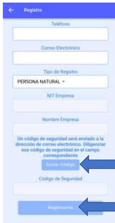
Ilustración 5. Formulario de registro