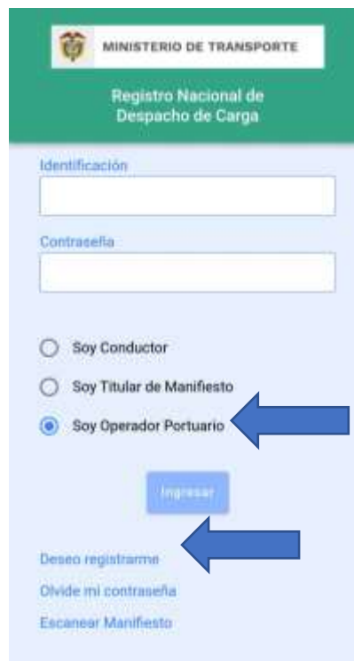
Ilustración 3. Opción para solicitud de usuario

Para iniciar el procedimiento de solicitud de usuario, se debe marcar la opción "Soy operador portuario" y seleccionar "Deseo registrarme".