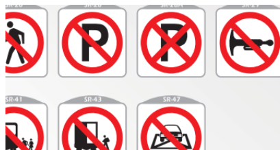
SR-28 PROHIBIDO PARQUEAR SR-28